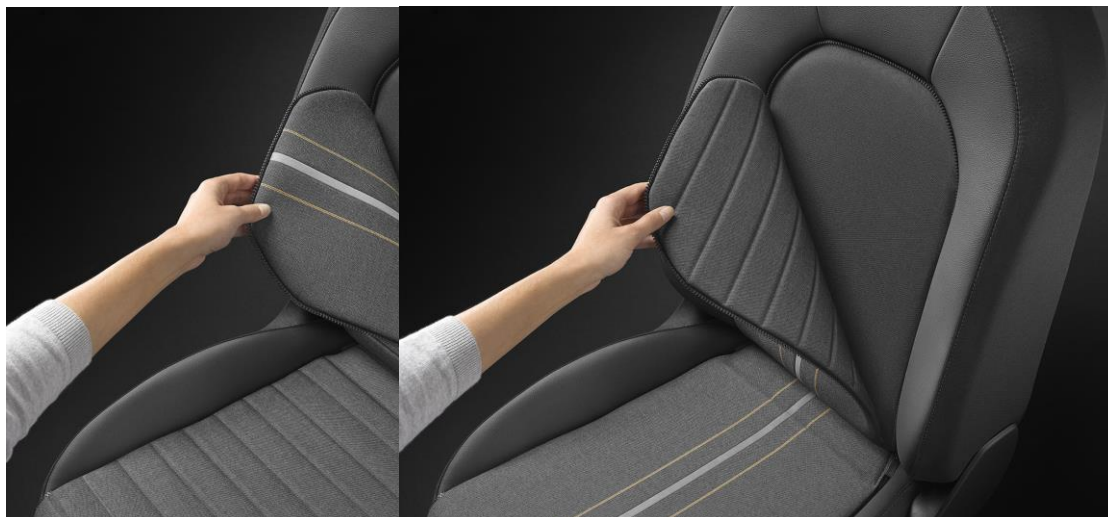
Meniteľné čalúnenie sedadiel (PQ1)

Odzipsovateľná stredná časť potáhov s možnosťou výberu "letnej" alebo "zimnej" strany. Verzia pre výbavu Style