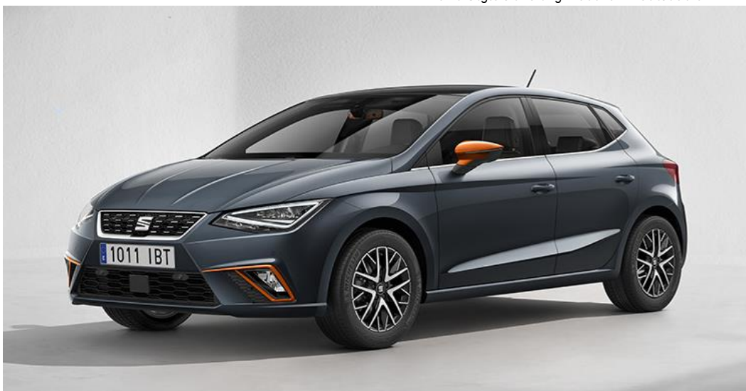
Ibiza Style s akciovým balíkom Beatsaudio